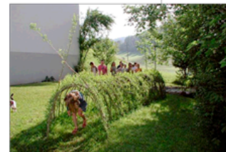
Einfriedung durch Weidenzaun / Weidentunnel